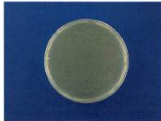
スイートシャワーキャラメル